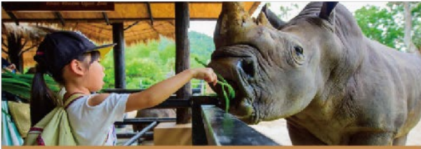
近距離觀賞、互動、餵食

充滿濃濃泰式風情的綠山國家公園，是東南亞最大的開放式動物園，飼養的動物種類多達300種，數量超過800隻，相當壯觀。這裡的動物不僅可以近距離觀賞，更可以餵食互動，除此之外，綠山國家動物園還準備精彩動物實景秀，讓您欣賞動物的神採模樣，如戲水的大嘴鳥、掠食的獅子、爬樹的老虎，種種難得畫面令人嘖嘖稱奇！