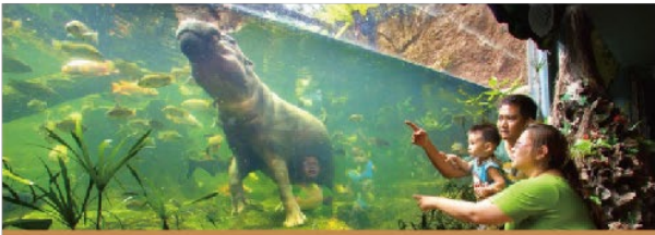
加贈有趣新奇的動物天性秀