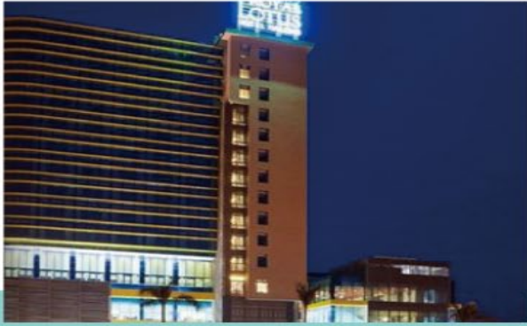
下龍 GOLDEN ROTUS