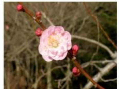
江南所無 (こうなんしょむ)

早咲きの時期の楽しみ方は“探梅”。まだ固い蕾が多い中、ほころんだ梅の花を一輪一輪探しながら散策してみましょう。