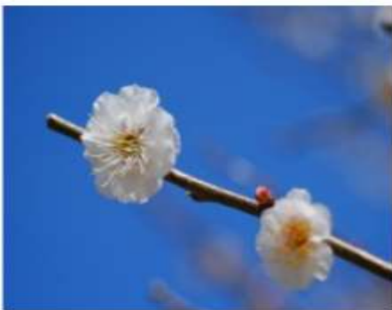
白雛波 (しろないわ)