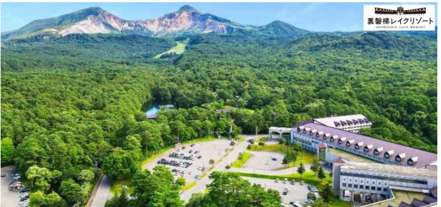
裏磐梯レイクリゾート URABANDAI LAKE RESORT