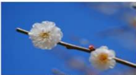
白鞠流（しろまにわ）

早咲きの時期の楽しみ方は“探梅”。まだ固い蕾が多い中、ほころんだ梅の花を一輪一輪探しながら散策してみましょう。 代表的な早咲き品種は「八重赤紅」「白鞠流」「八重冬至」「烈公梅」など。