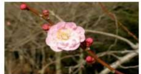
江南所無（こうなんじょむ）

遅咲きの時期の楽しみ方は“送梅”。遅く咲き始めた梅の香りを楽しみながら、去りゆく梅の季節を見送ってみましょう。 代表的な遅咲き品種は「白加賀」「春日野」「江南所無」などです。