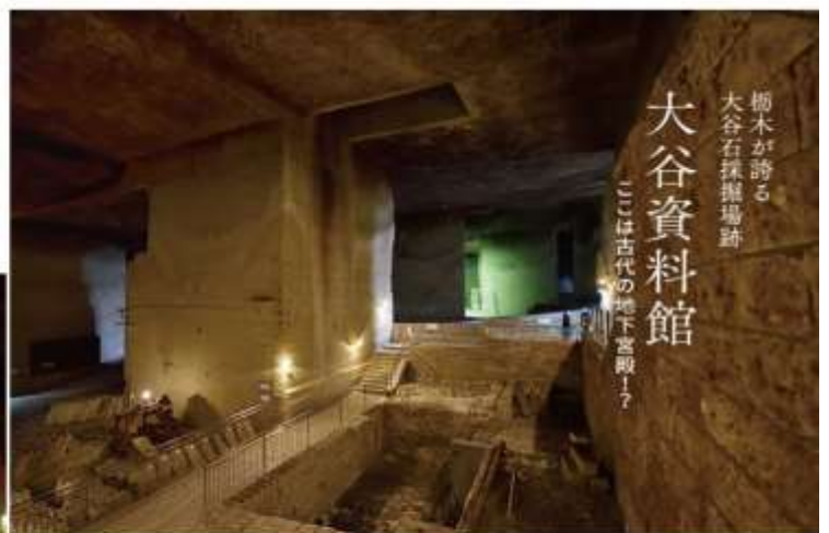
位於宇都宮市街西北約7公里位置的大谷地區，產出的大谷石，為著名的建築物、倉庫藏、民家藏等，其活用幅度很廣。在高度成長期需要大力的延伸，在大谷地區採掘盛行。在採掘場形成巨大的地下空間。同時，於現在跡地能見到古代遺跡那樣的趣味。成為飄浮著幻想氣氛的獨特場所之地下空間。宇都宮一個魅力之物大谷石的地下世界，年均溫維持在攝氏九度。