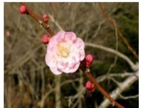
江南所無（こうなんしょむ）

遅咲きの時期の楽しみ方は“送梅”。遅く咲き始めた梅の香りを楽しみながら、去りゆく梅の季節を見送みましょう。