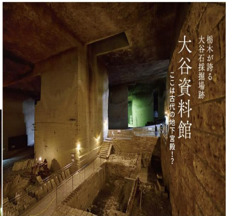
栃木が誇る 大谷石採掘場跡 大谷資料館 ここは古代の地下宮殿!?

位於宇都宮市街西北約7公里位置的大谷地區，產出的大谷石。為著名的建築物、倉庫藏、民家藏等、其活用幅度很廣。在高度成長期需要大力的延伸，在大谷地區採掘盛行。在採掘場形成巨大的地下空間。同時，於現在跡地能見到古代遺跡那樣的趣味。成為飄浮著幻想氣氛的獨特場所之地下空間。宇都宮一個魅力之物大谷石的地下世界，年均溫維持在攝氏九度。