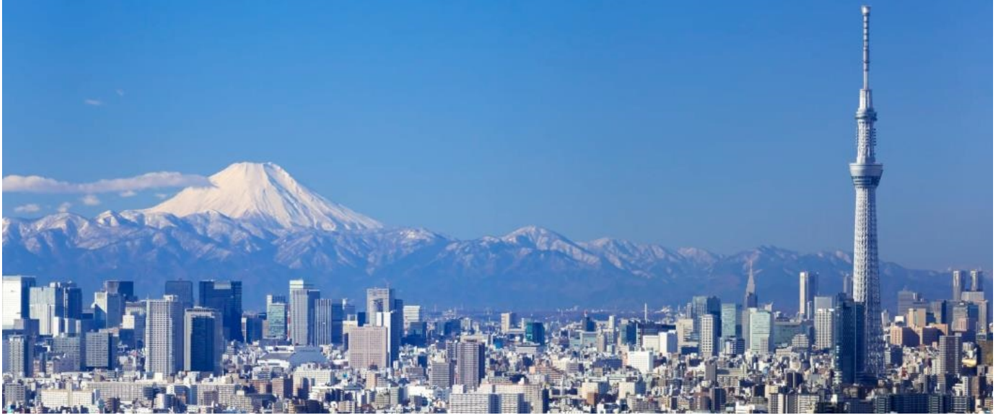
東京晴空塔SKYTREE 350M展望台