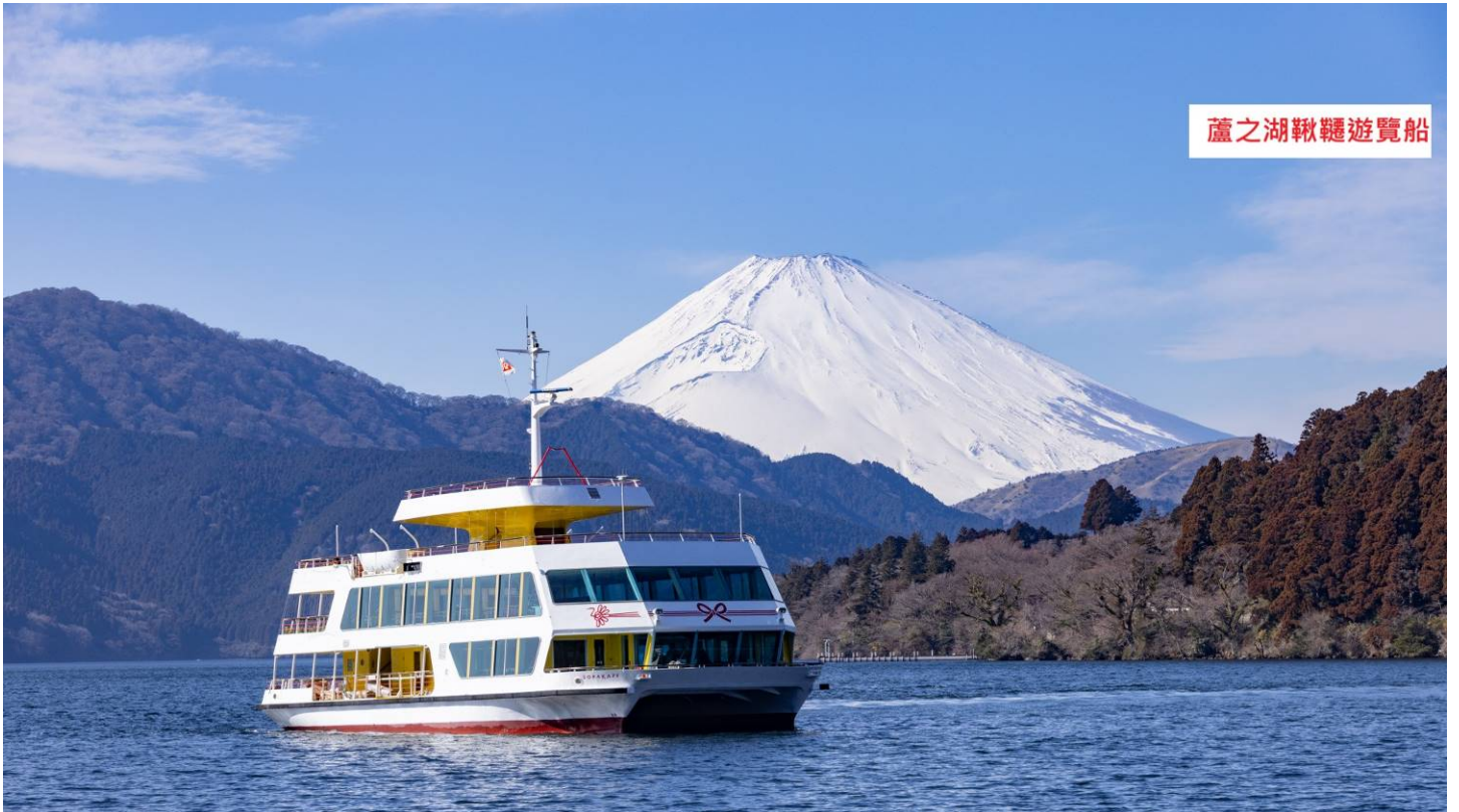
蘆之湖鞦韆遊覽船