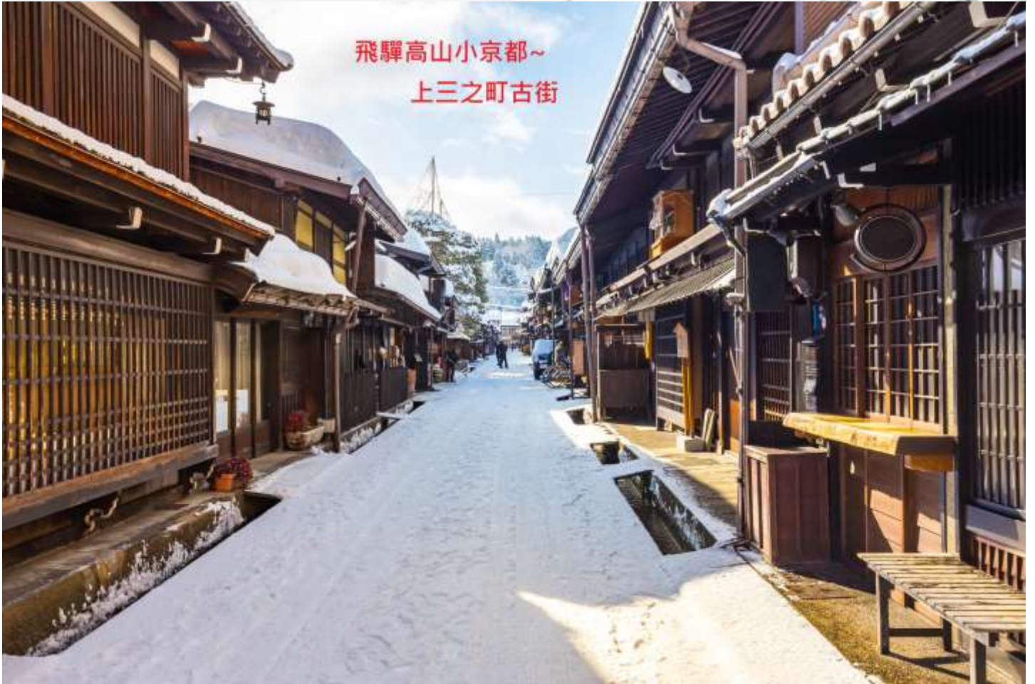
飛驒高山小京都~ 上三之町古街