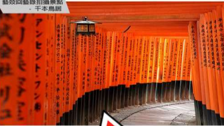
藝妓回藝錄拍攝景點 - 千本鳥居