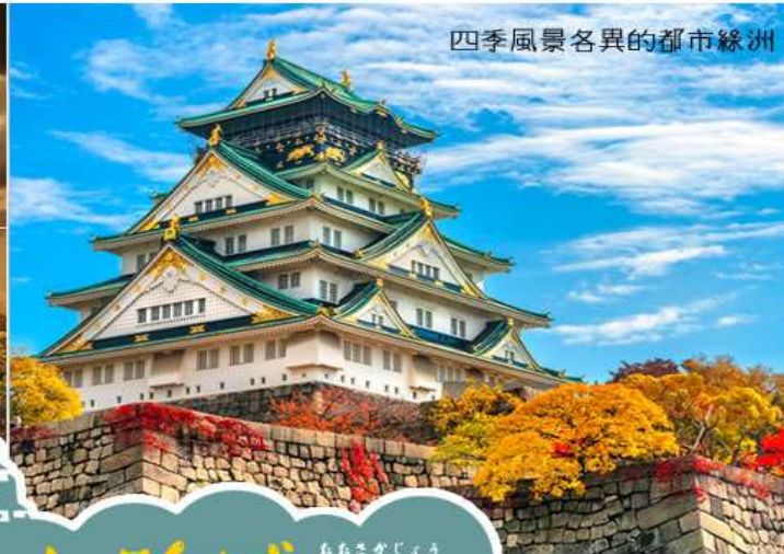
四季風景各異的都市綠洲