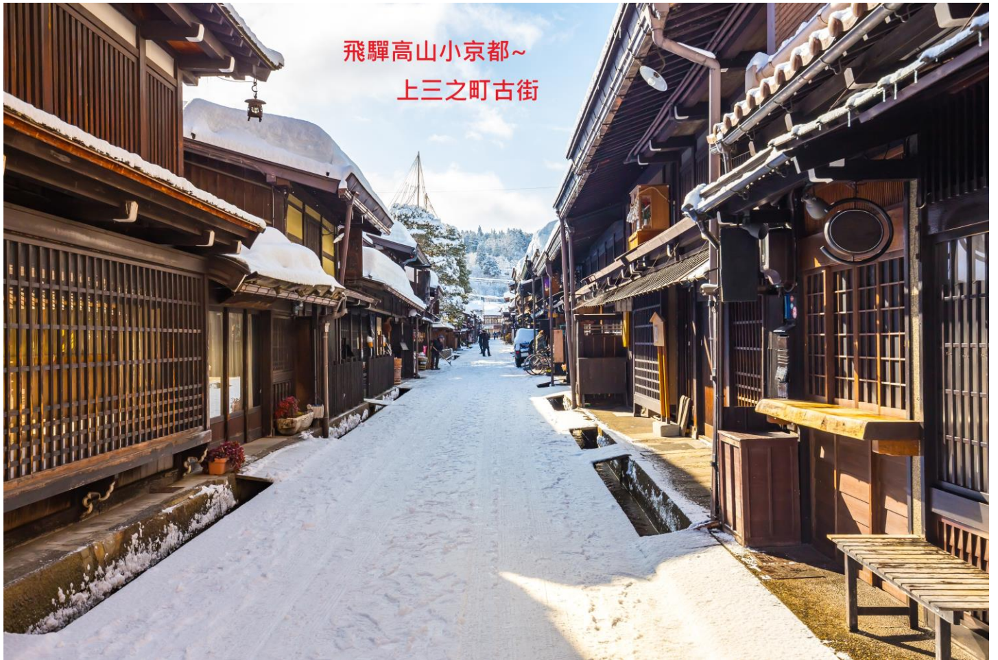
飛驒高山小京都~ 上三之町古街