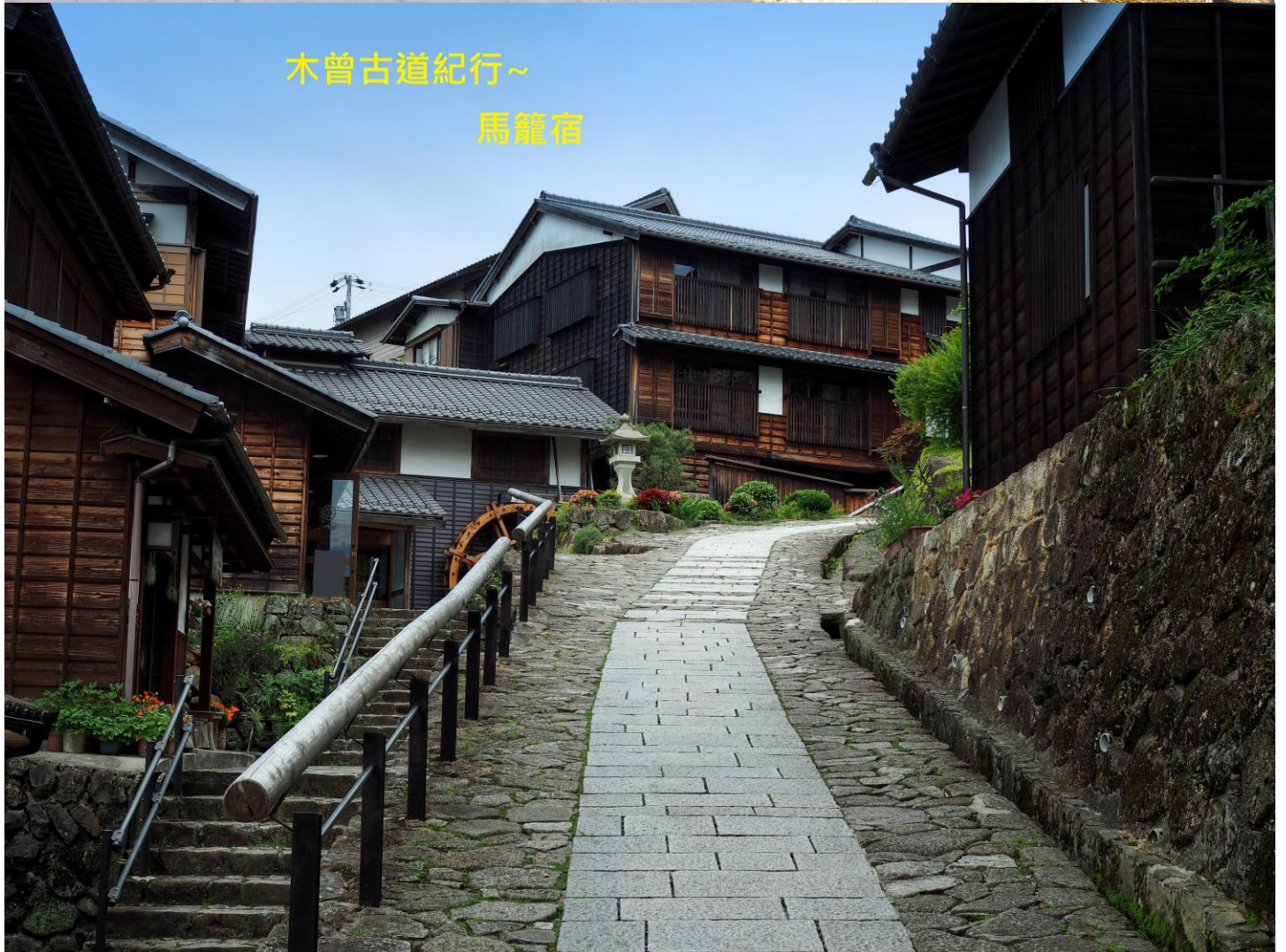
木曾古道紀行~ 馬籠宿