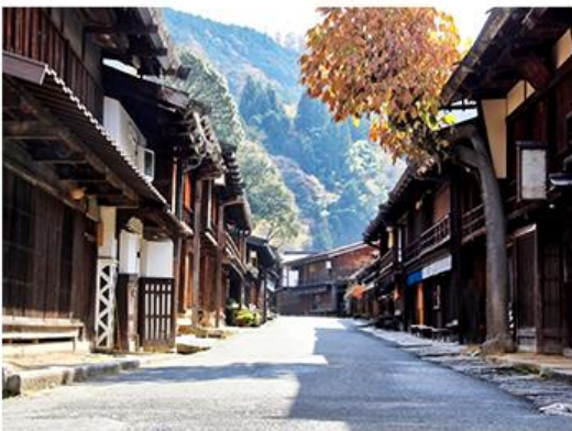
東茶屋街 漫步滿溢日本風情的金澤老街