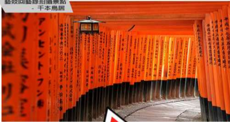
藝妓回藝錄拍攝景點 - 千本鳥居