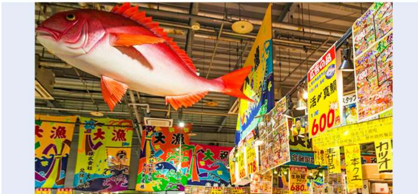
西日本最大極海鮮市場，位於和歌山白濱的「ToreTore市場南紀白濱」（とれとれ市場），為西日本最大規模的海鮮市場，場內販售日本全國四季新鮮的魚蝦貝類，和歌山的農特產品。