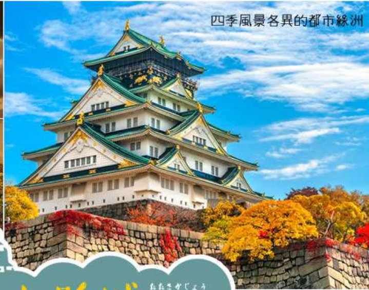
四季風景各異的都市綠洲