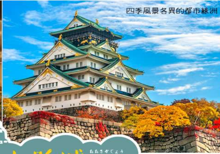
四季風景各異的都市綠洲