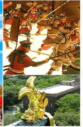
四季風景各異的都市綠洲