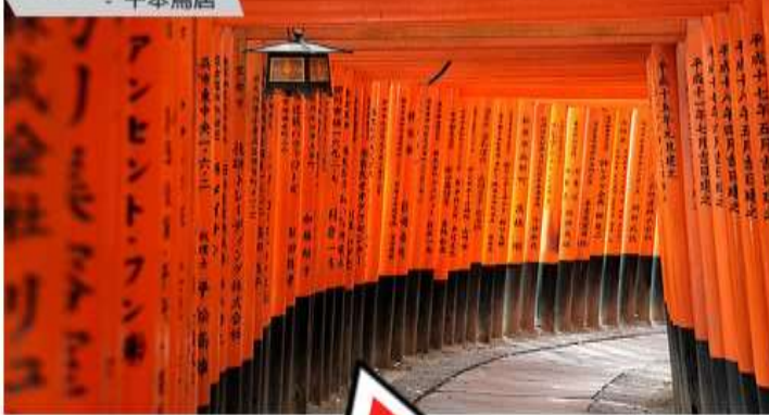
藝妓回藝錄拍攝景點 - 千本鳥居