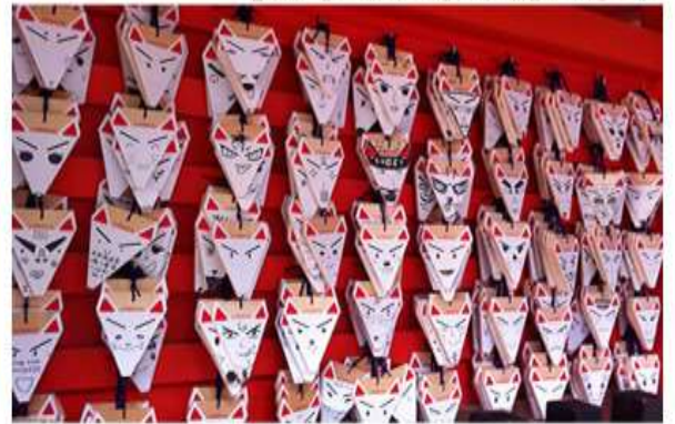
ふしみいなりたいしゃ