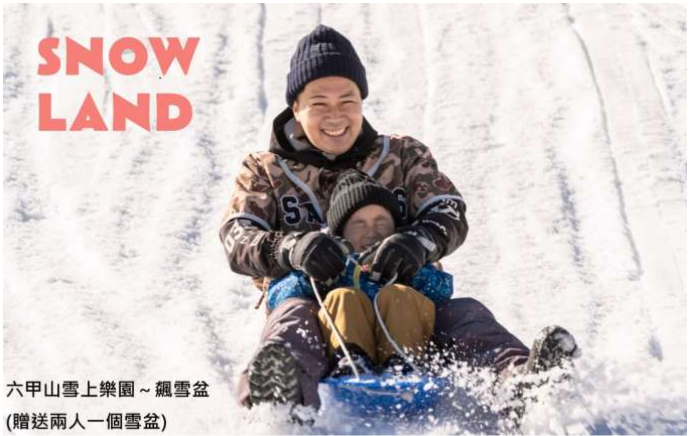
六甲山雪上樂園 ~ 飄雪盆 (贈送兩人一個雪盆)