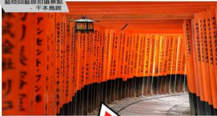
藝妓回憶錄拍攝景點 - 千本鳥居