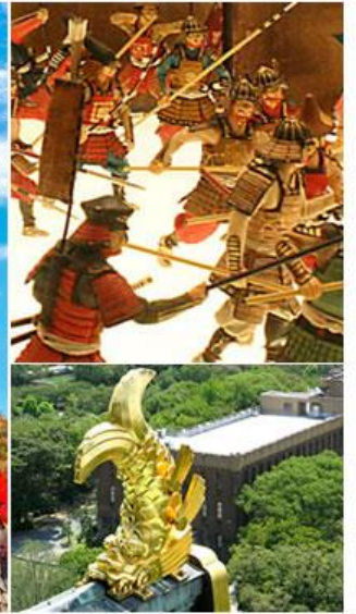
四季風景各異的都市綠洲