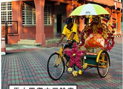
馬六甲復古三輪車