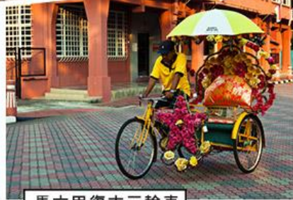
馬六甲復古三輪車