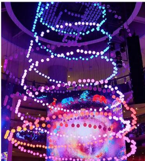
SkySymphony 光與聲的夢幻交響樂