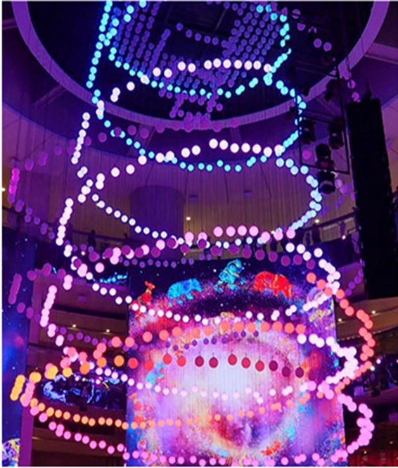
SkySymphony 光與聲的夢幻交響樂