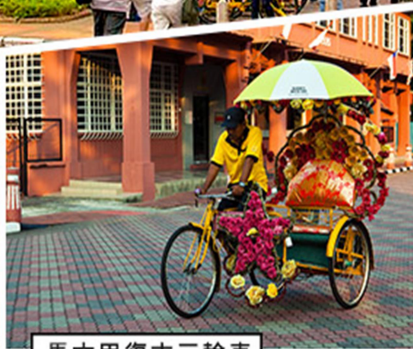
馬六甲復古三輪車