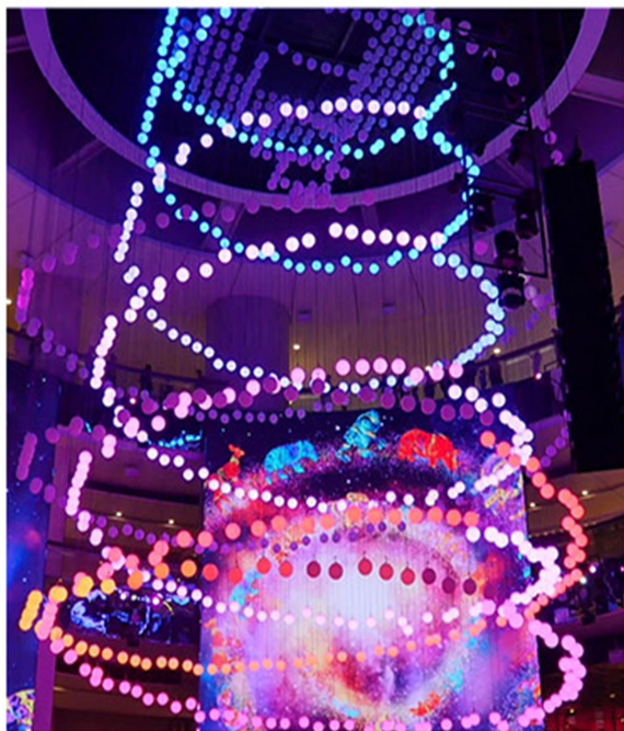
SkySymphony 光與聲的夢幻交響樂