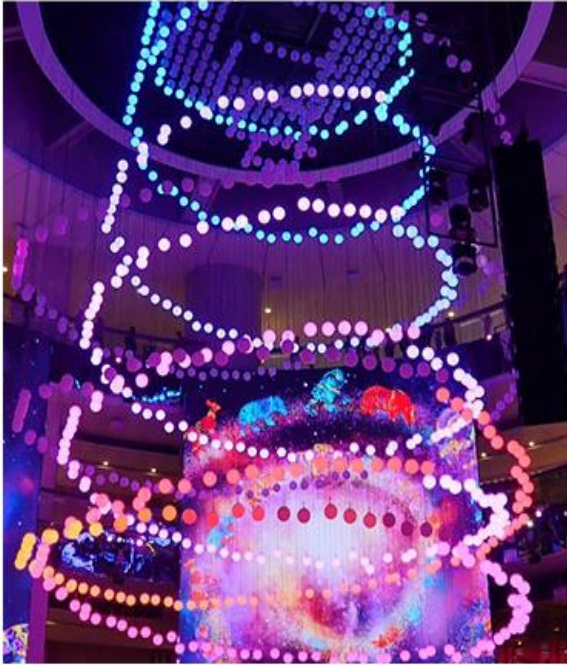
SkySymphony 光與聲的夢幻交響樂