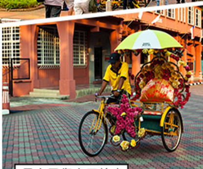
馬六甲復古三輪車