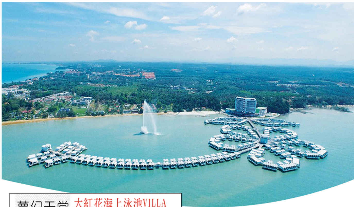
夢幻天堂 大紅花海上泳池VILLA HIBISCUS RESORT