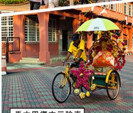
馬六甲復古三輪車