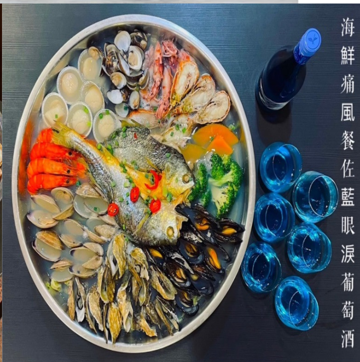
海鮮痛風餐佐藍眼淚葡萄酒