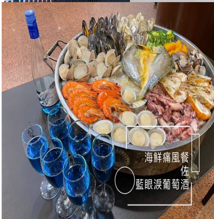
海鮮痛風餐佐 藍眼淚葡萄酒