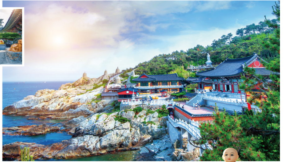
Haedong Yonggungsa Temple

原名普門寺，是韓國三大觀音聖地之一。傳說只要在此地真心誠意地祈禱，菩薩將會於夢中顯靈並實現一個願望。