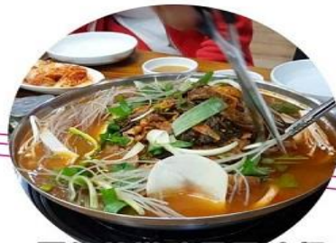
馬鈴薯燉豬骨風味餐