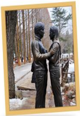
韓劇《冬季戀歌》 浪漫拍攝場景