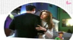
遇見-《來自星星的你》 《初雪花園》《Runningman》