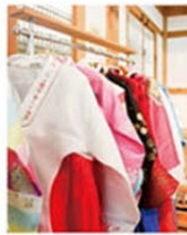
韓服 身體 體驗

穿上由現場放置的展示衣，帮大家依照身材挑選傳統的韓服，並在古色古香的場景前照相留念囉！