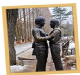
韓劇《冬季戀歌》 浪漫拍攝場景