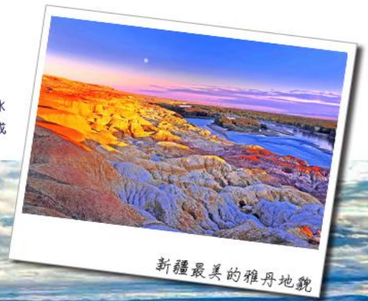
新疆最美的雅丹地貌