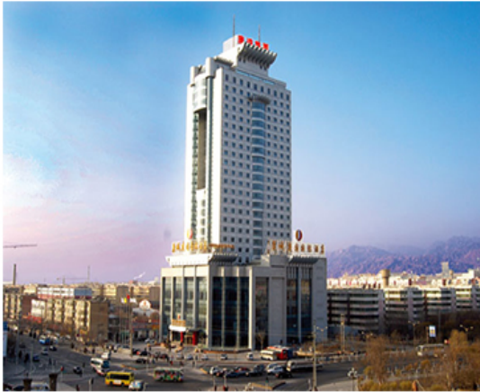
庫爾勒 ★★★★★康城建國國際大酒店或同級