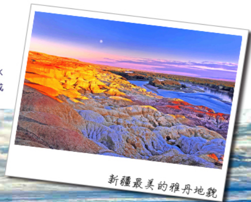
新疆最美的雅丹地貌