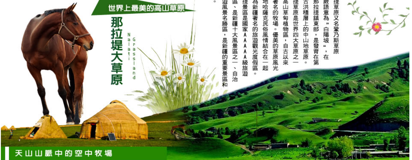
天山山脈中的空中牧場