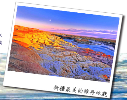
新疆最美的雅丹地貌

上帝打翻的調色盤!就像是一幅油畫巨作,令人醉心,畫中有著五彩山,如同美人般端立其間,地貌起伏下形成奇峰怪石各種姿態,呈現赭紅為主夾雜黃白黑綠等多種顏色,中國唯一一條注入北冰洋的河流--額爾齊斯河穿其而過。南岸有綠洲、沙漠,北岸則是色彩斑斕的泥岩、沙岩及砂礫組成的奇岩怪石,兩種截然不同的地貌,唇齒相依地遙相輝映。可謂“一河隔兩岸,自有兩重天”。