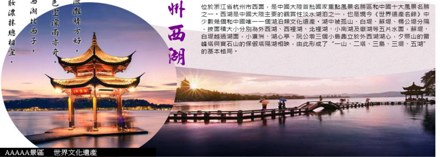
AAAAA景區 世界文化遺產