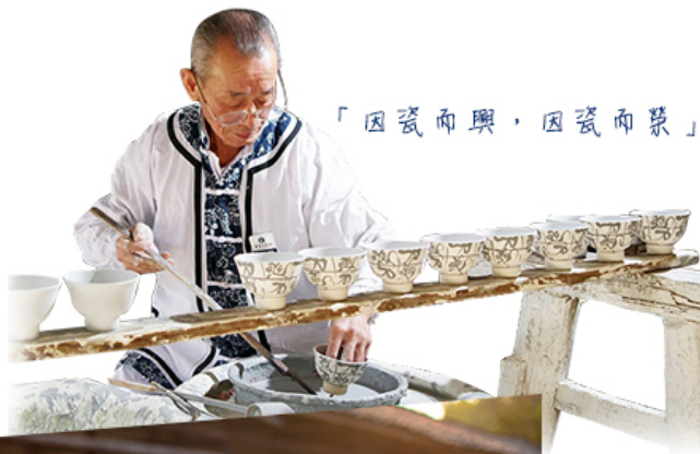
「因瓷而興，因瓷而景」

陶瓷民俗博物館屬人文與自然完美結合的典範風景區。集陶瓷文化博覽、傳統陶瓷製作體驗及娛樂休閒為一體，分別由古窯和陶瓷民俗博覽館兩部分組成。景德鎮出產的瓷器行銷海外40多個國家，以其「白如玉、薄如紙、明如鏡、聲如磬」的品質名揚天下，城裡的陶瓷一條街是陶瓷工藝品的集散之地。