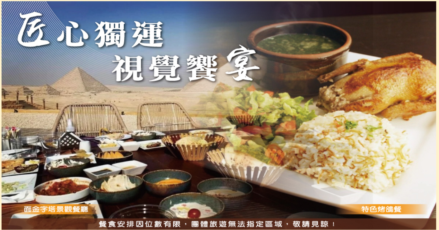
面金字塔景觀餐廳