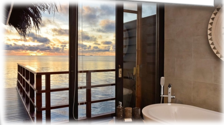
機場島飯店 Samann Host X 1 晚(或同級)