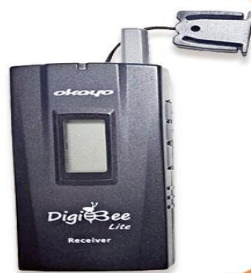
全程專業導覽耳機

本行程所附之語音導覽器為租借使用，如因旅客個人因素遺失或損壞，依廠商規定需賠供每台機器NT$2000，特此說明。