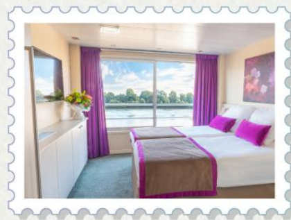
三樓上層·法式陽台房