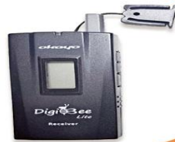
全程專業導覽耳機

本行程所附之語音導覽器為租借使用, 如因旅客個人因素遺失或損壞, 依廠商規定需賠償每台機器NT$2000, 特此說明。