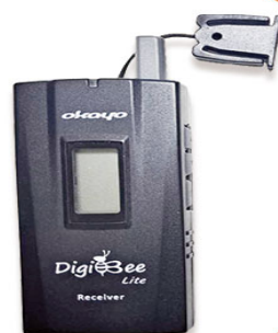
全程專業導覽耳機

本行程所附之語音導覽器為租借使用, 如因旅客個人因素遺失或損壞, 依廠商規定需賠償每台機器NT$2000, 特此說明。