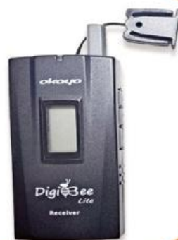
全程專業導覽耳機

本行程所附之語音導覽器為租借使用, 如因旅客個人因素遺失或損壞, 依廠商規定需賠供每台機器NT$2000, 特此說明。