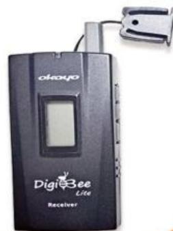
全程專業導覽耳機

本行程所附之語音導覽器為租借使用, 如因旅客個人因素遺失或損壞, 依廠商規定需賠供每台機器NT$2000, 特此說明。