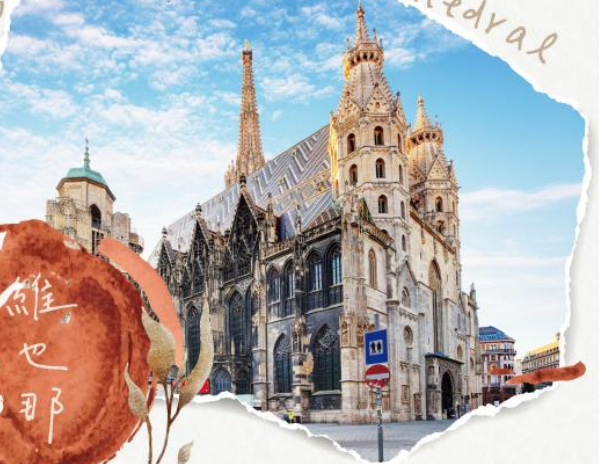
S. Stephen's Cathedral

位於奧地利維也納市中心，是天主教維也納總教區的總主教座堂，同時擁有全球第二高的哥德式尖塔。其色彩斑斕、圖案精緻的琉璃瓦拼花屋頂，更使其成為維也納最具代表性的地標之一。