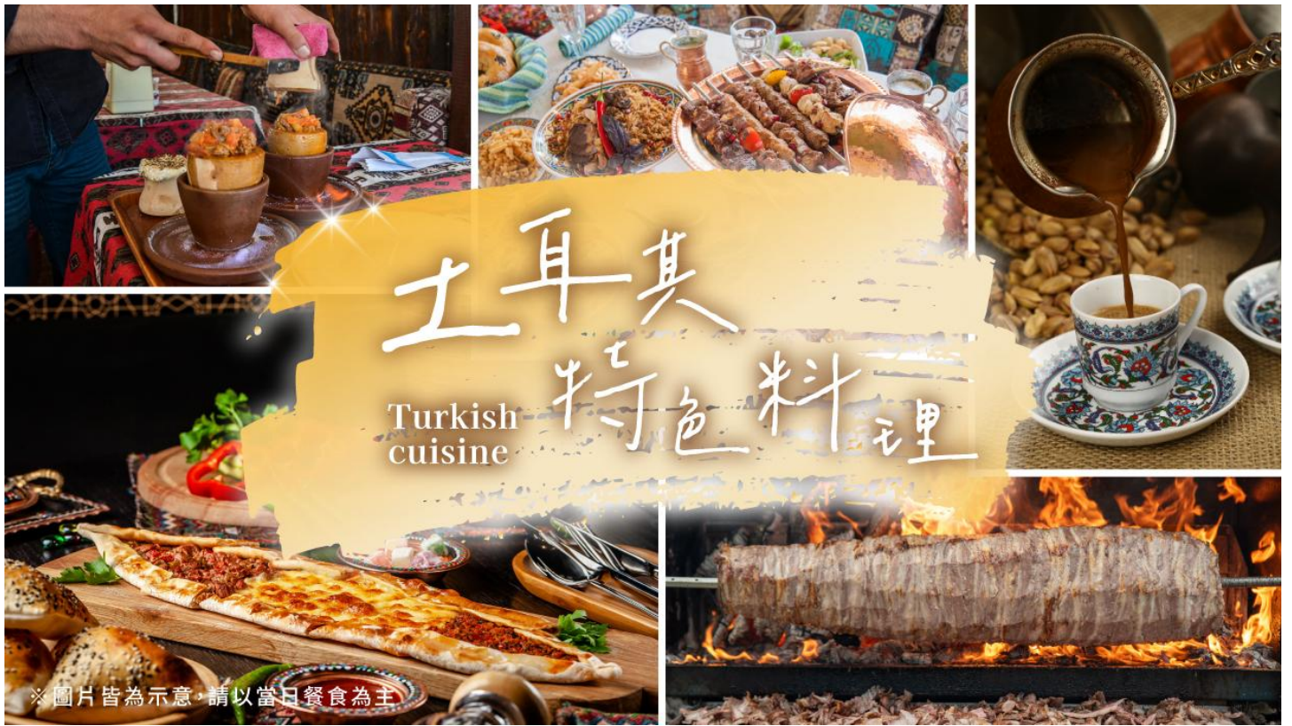
※ 圖片皆為示意，請以當日餐食為主