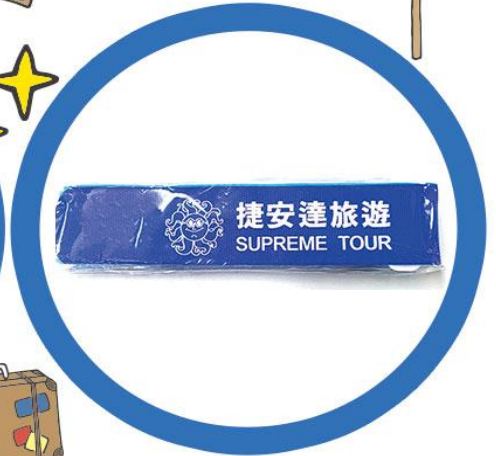
行李束帶一條 (顏色隨機)