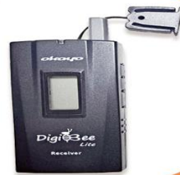
全程專業導覽耳機

本行程所附之語音導覽器為租借使用，如因旅客個人因素遺失或損壞，依廠商規定需賠供每台機器NT$2000，特此說明。